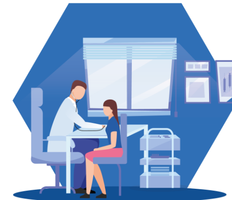
Accès au médecin traitant